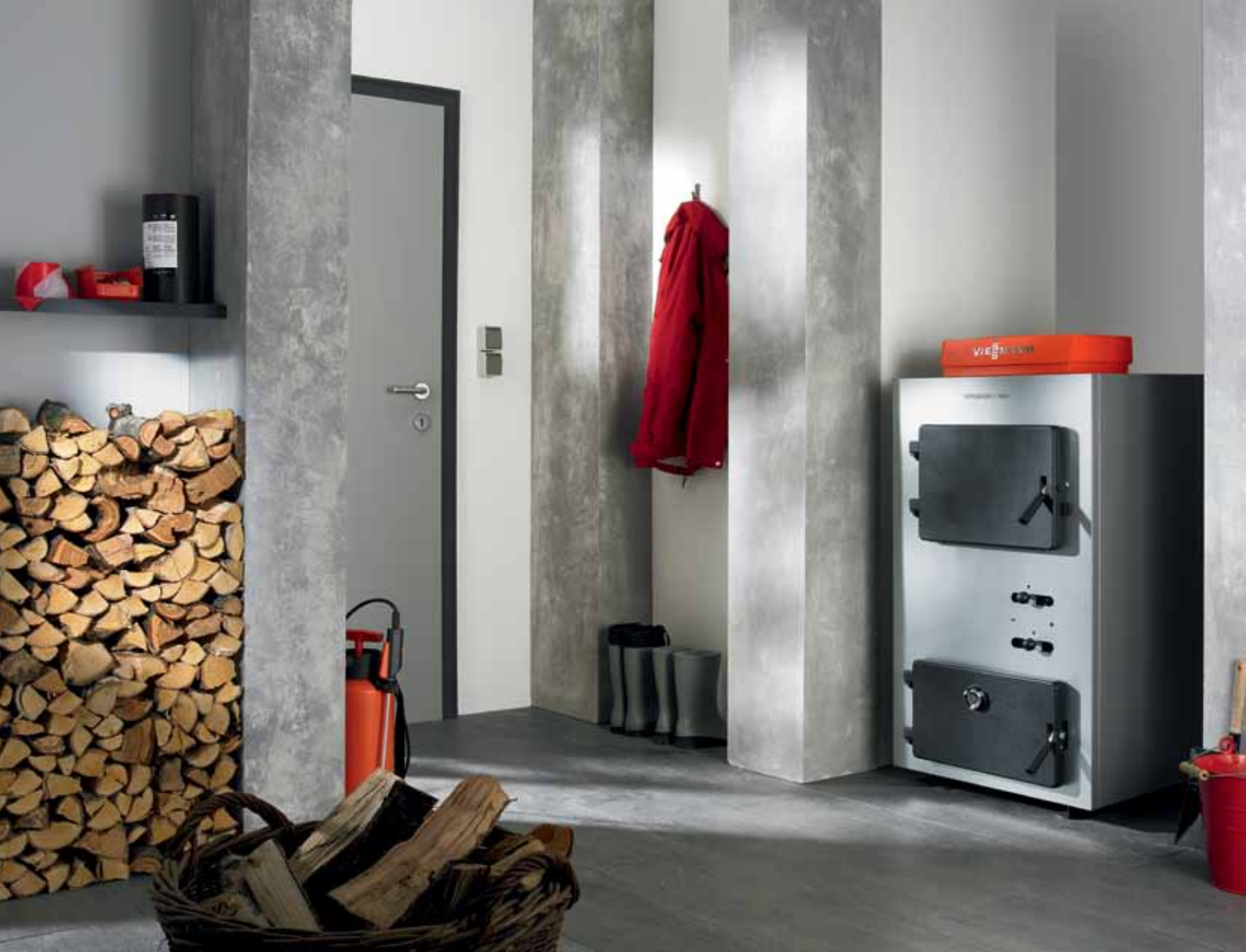
Vitoligno 100-S faelgázostó kazán