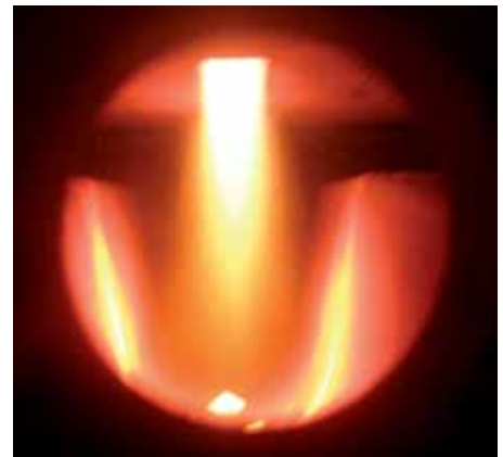
A speciális kerámia tüztér működés közben

A felhevített fahasábokból kilépő fagáz magas hőmérsékleten ég, ezért a tüztér megfelelő ipari kerámiából készült. Az elégetéshez a töltőtérből ventilátor szívja be a felhevített fagázt. A töltőtér szívott, így utántöltés során nem tud füstgáz a felállítási helyiségbe kerülni. Az égés magas, akár 85% feletti tüzelés-technikai hatásfokkal megy végbe.