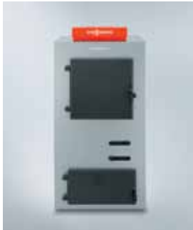
Vitoligno 100-S faelgázosító kazán